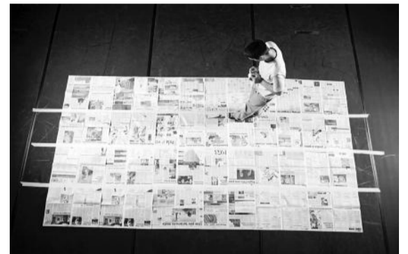
Materiais Diversos