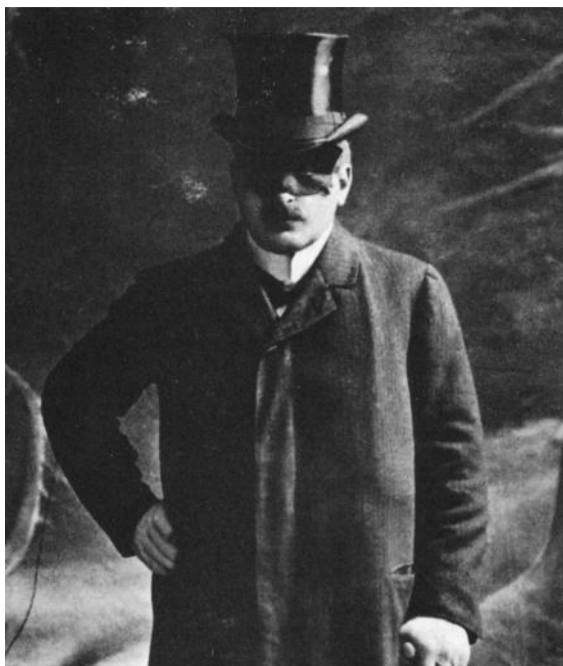
Frank Wedekind, O Senhor Disfarçado em O Despertar da Primavera, Viena, 1908