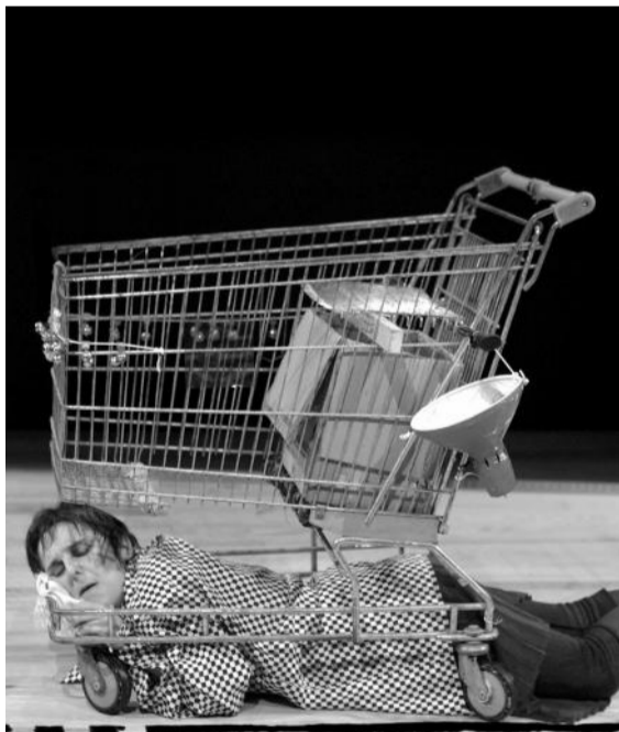
Adélio Z

concepção JÉRÔME BEL co-produção TNSJ (Porto), KAAITHEATER (Bruxelas), INTERNATIONALES TANZFEST BERLIN: HEBBEL AM UFER, TANZWERKSTATT BERLIN (Berlim), LES SPECTACLES VIVANTS-CENTRE POMPIDOU (Paris), FESTIVAL D'AUTOMNE (Paris), R. B. (Paris) com o apoio de ALLIANZ KULTURSTIFTUNG (Munique), STUK KUNSTENCENTRUM (Leuven), CENTRE CHORÉGRAPHIQUE NATIONAL DE MONTPELLIER LANGUEDOC-ROUSSILLON, PROGRAMME ReRC (Montpellier)