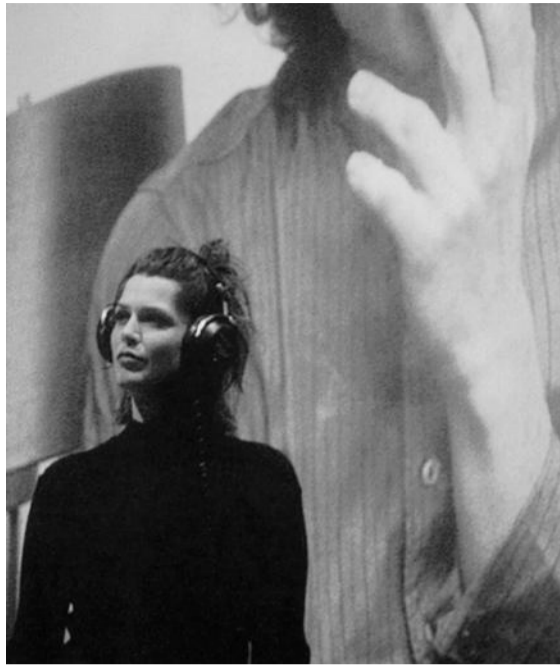
A Vida e Cheia de Som & Fúria (Sutil Companhia de Teatro/Brasil)

texto, encenação e concepção cenográfica CARLOS J. PESSOA produção TEATRO DA GARAGEM