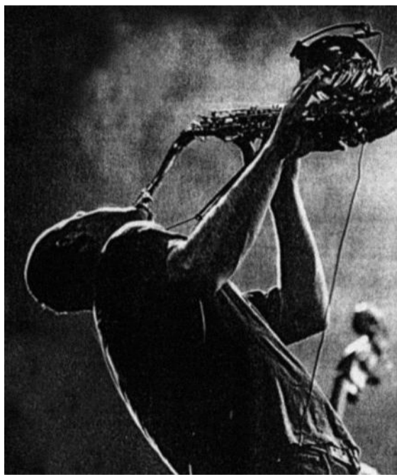
Akosh S. Unit

de JOÃO DE MELO dramaturgia, encenação e concepção do espaço cénico JOÃO BRITES