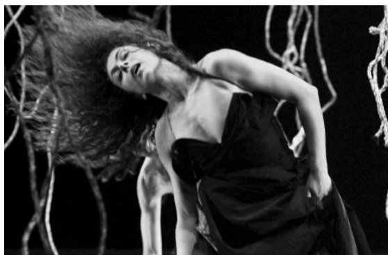
Jump-up-and-kiss-me