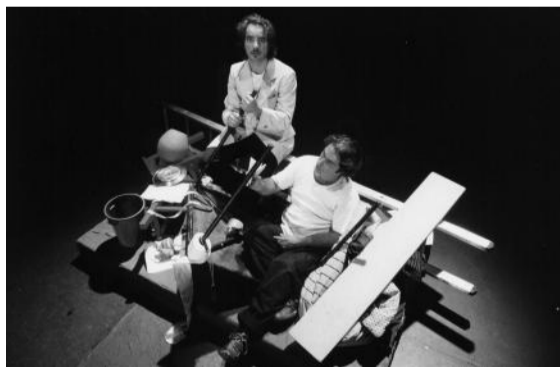
Don Quixote