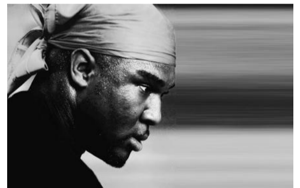
Nonso Anozie

09 + 10 JUL'04 TeCA 40 Espontâneos coreografia LA RIBOT co-produção LE QUARTZ – BREST SCÈNE NATIONALE (França), THÉÂTRE DE LA VILLE (Paris), LA BÂTIE – FESTIVAL DE GENÈVE (Suíça) com o apoio de ARTS COUNCIL ENGLAND