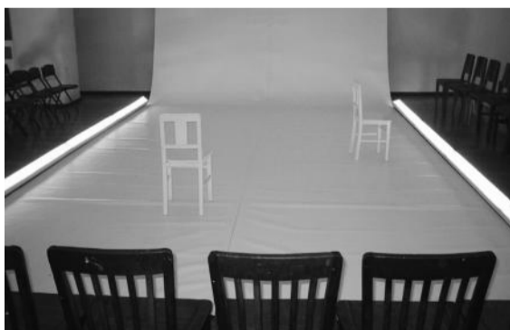
Escrever, Falar

texto de WILLIAM SHAKESPEARE encenação RICARDO PAIS produção TNSJ