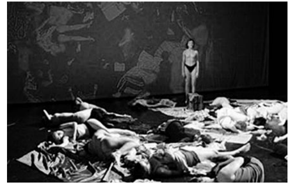
40 Espontâneos (La Ribot)

a partir de WILLIAM SHAKESPEARE + a partir de MIGUEL DE CERVANTES encenação JOHN MOWAT produção COMPANHIA DO CHAPITÔ